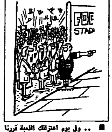
وفي يوم اعتزلك اللعبة قرينا اعداد حفلة « طرد » خاصة بهده اقسامية !